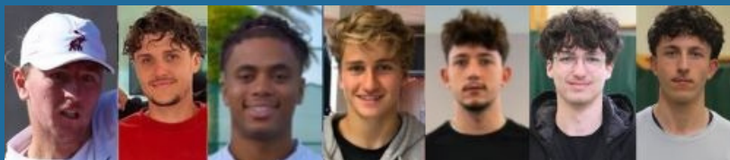
EQUIPE HOMMES 1