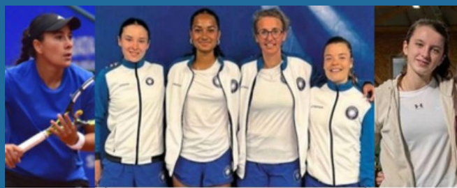
EQUIPE FEMMES 1